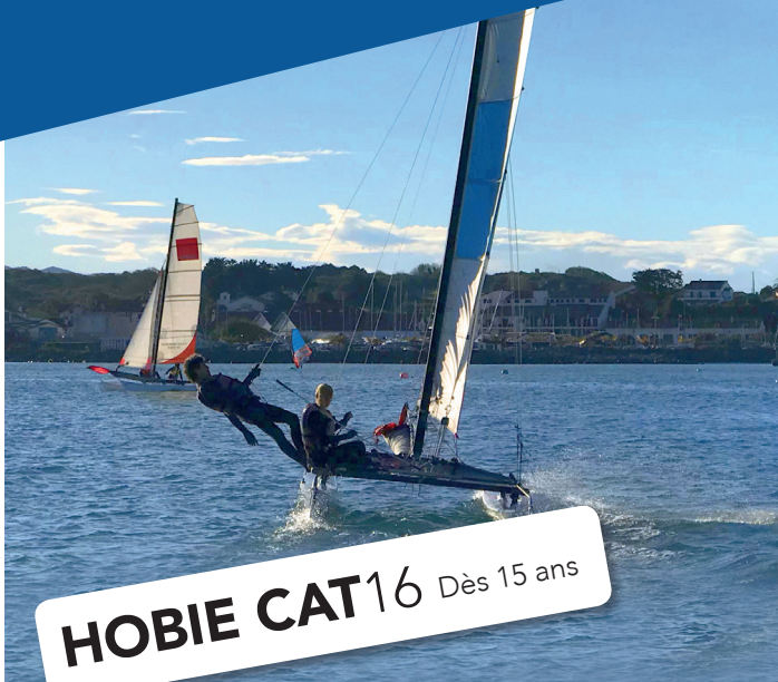
HOBIE CAT16 Dès 15 ans