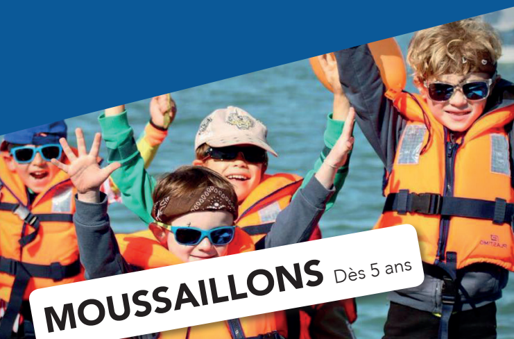
MOUSSAILLONS Dès 5 ans