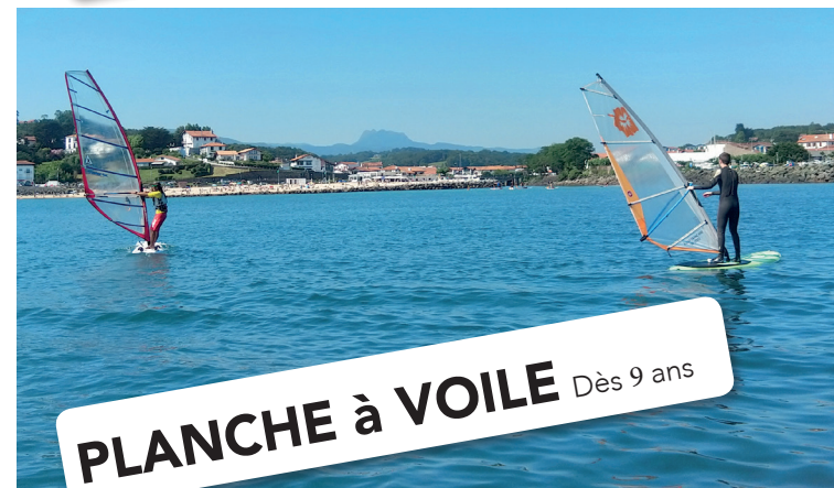
PLANCHE à VOILE Dès 9 ans