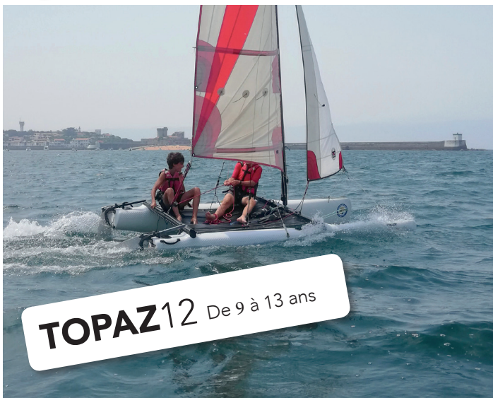
TOPAZ12 De 9 à 13 ans