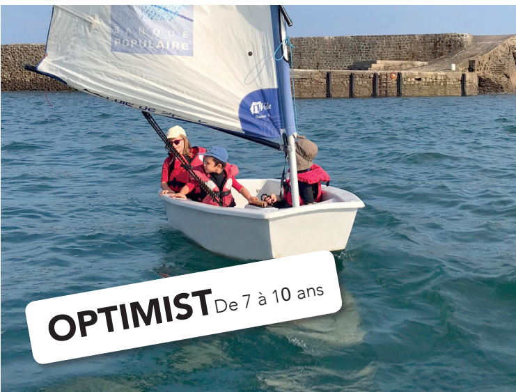
OPTIMIST De 7 à 10 ans