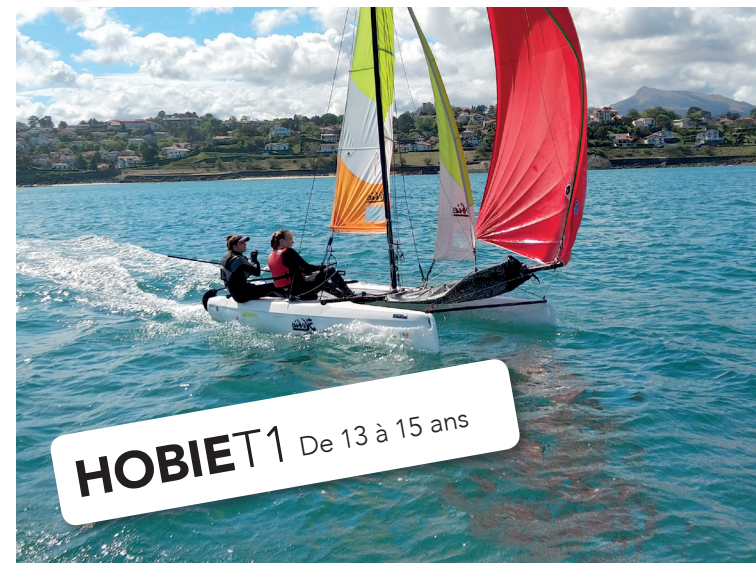
HOBIE1 De 13 à 15 ans